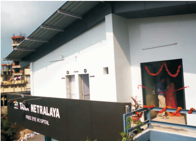
‘तारा नेत्रालय’, मुम्बई