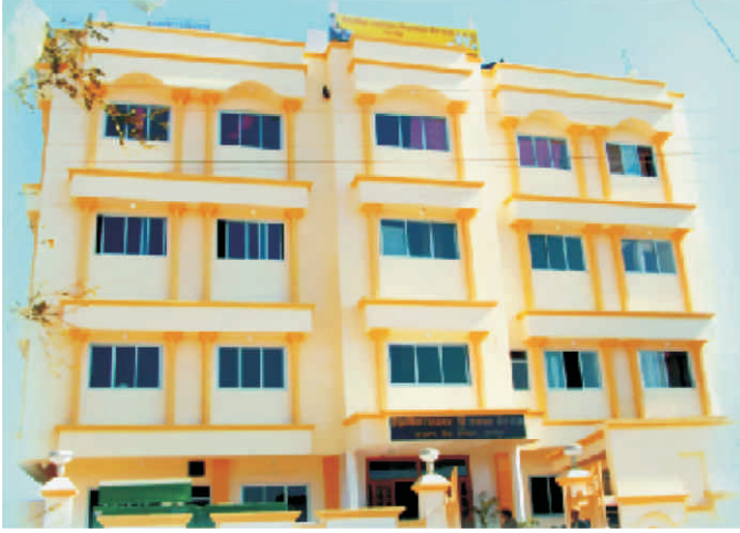
‘तारा नेत्रालय’, उदयपुर